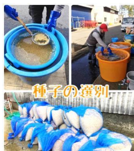
4月4日撮影 濃度の高い塩水につけて 沈んだ良い種だけを選別