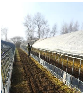
4月2日撮影 お米の苗を育てる為の ビニルハウス張り作業