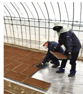
4月16日撮影 ピニルハウス内に種を 蒔いた苗箱を並べる作業