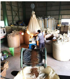
3月31日撮影 お米の種を蒔く箱の土用に 土と肥料を合わせる作業

春作業の内容を簡単ですが写真でご紹介いたします。5月中旬からは田植えが始まります。