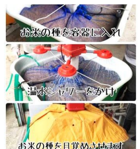
4月11日撮影 お米の種を加温し目覚め させる(芽出し)作業