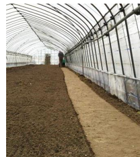
4月8日撮影 ビニルハウス内の地面を 圧をかけて平らにする