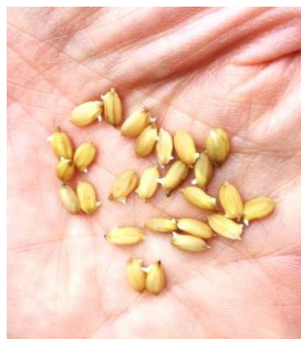
4月13日撮影 24時間加温を続け お米の芽が出てきた！