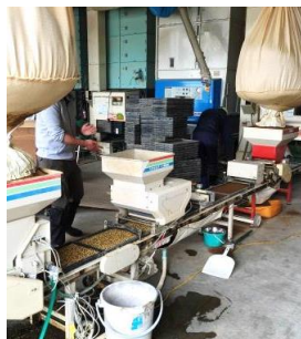
4月15日撮影 芽出したお米の種を 苗箱という箱に蒔く作業