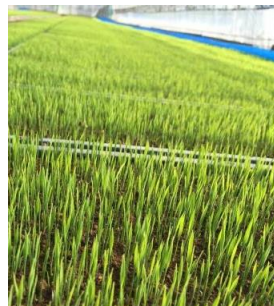
4月23日撮影 お米の苗が緑化し 段々と成長してきた